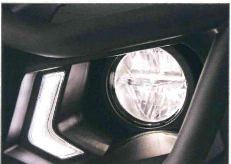
UMX Licht-Upgrade-Kit Teile Nr. J0GH43C0T000