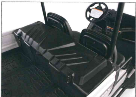
Heckstaukasten Teile Nr. J0GF83P0V000