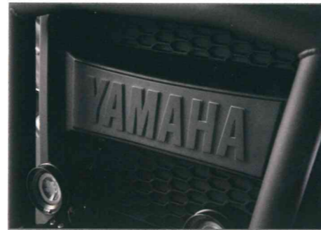
Frontbügel, Rohr Teile Nr. J0GF85F0V000