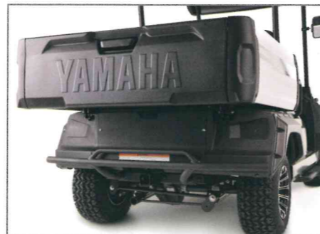
Heckbügel, Rohr Teile Nr. J0GF85F0S000