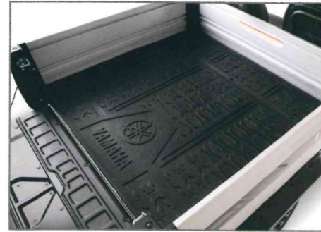
Ladeflächenmatte Teile Nr. J0GF7302V000