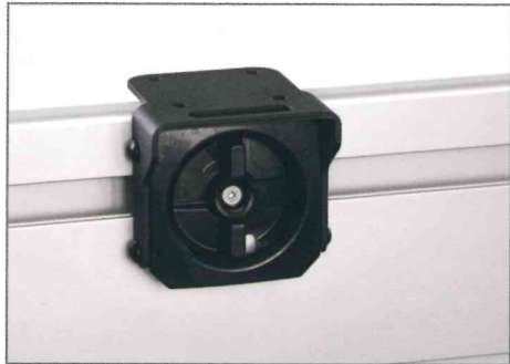
FusionFit Befestigungs-Kit für Ladeflächenschienen Teile Nr. J0GF34A0V000