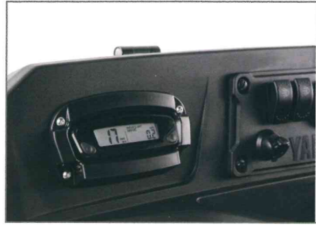
Multifunktionsanzeigen-Kit für das Armaturenbrett Teile Nr. J0GH35H0V000