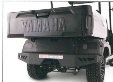
Heckbügel, Blech Teile Nr. J0GF85F0T000