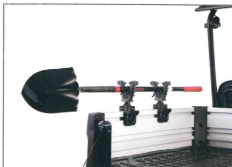
V-Grip, doppelt Teile Nr. ABAVFG200000